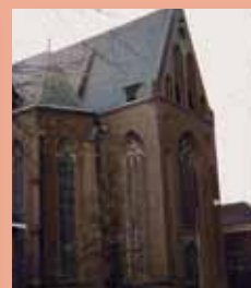
Maria ten Hemelopneming, gesloopt, opgegaan in de Josephparochie