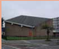
Emmauskerk, nu moskee, opgegaan in de Rafaëlparochie

Enkele kerken uit het gebied van onze huidige Ludgerus-parochie, die al eerder aan de eredienst onttrokken, gesloten of zelfs gesloopt worden: