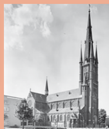
Monicakerk, gesloopt, opgegaan in de Nicolaas-Monicaparochie