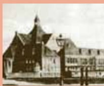
O.l.v. van Goede Raad: gesloopt, opgegaan in de Antoniusparochie